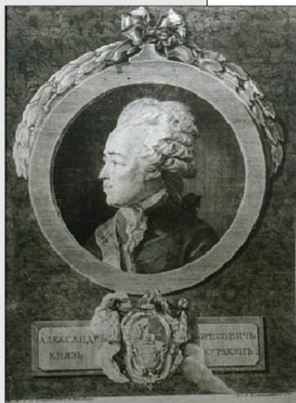
А.Я. Колпашников. Портрет князя Александра Борисовича Куракина. 1783 г. Гравюра с оригинала Де Велли 1779 г.