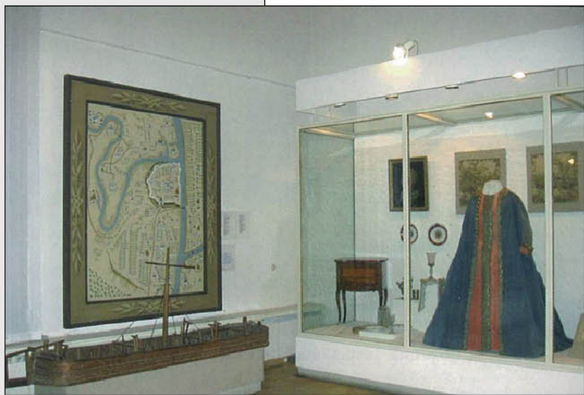
Белый зал Тверского музея. Платье-мундир Екатерины II.