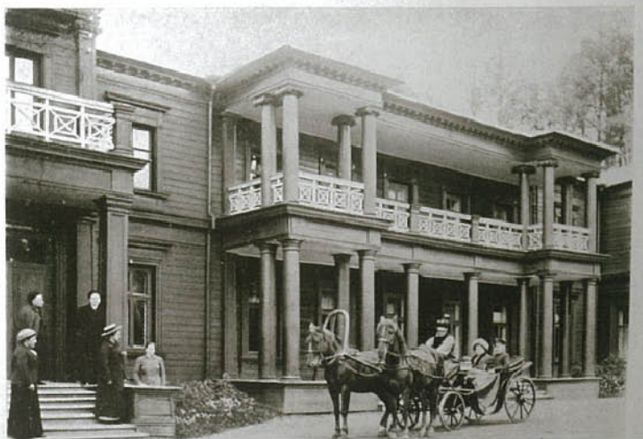
Дом кн. Куракиных в Андреевском.