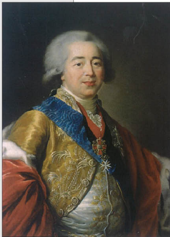
М.-Л.-Э. Виге-Лебрен. Портрет князя Александра Борисовича Куракина. 1796 г. ГМЗ «Гатчина».