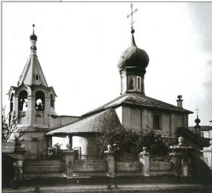
Церковь Гребневской Божьей Матери.