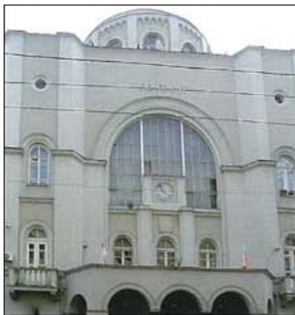
Здание Московского Почтамта на месте владения Куракиных.