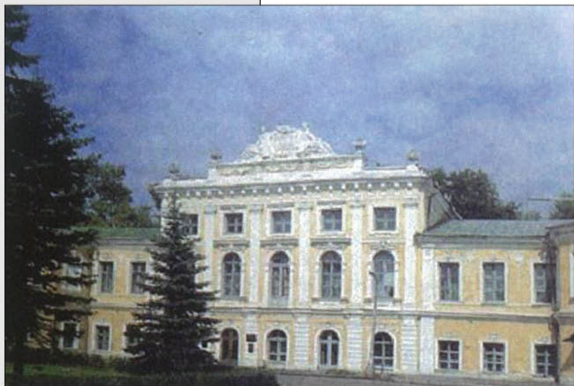
Тверской императорский дворец.