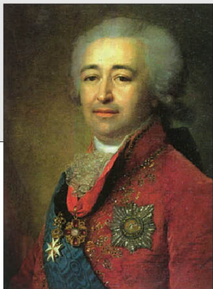
В.А. Боровиковский. Портрет князя Александра Борисовича Куракина. 1799 г. (?) ГИМ.