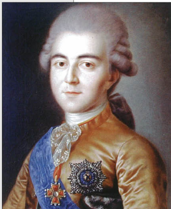
Неизвестный художник. Портрет князя Александра Борисовича Куракина. Тип Рослена. Тверская картинная галерея.