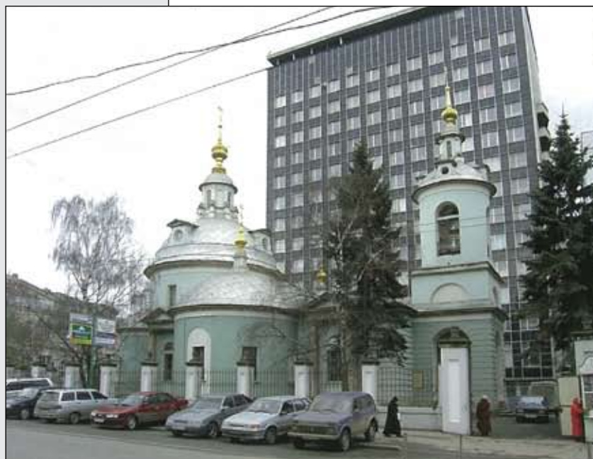
Церковь Козьмы и Дамиана на Маросейке.