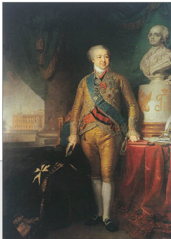
В.А. Боровиковский. Портрет князя Александра Борисовича Куракина. 1801–1802 гг. ГТГ.