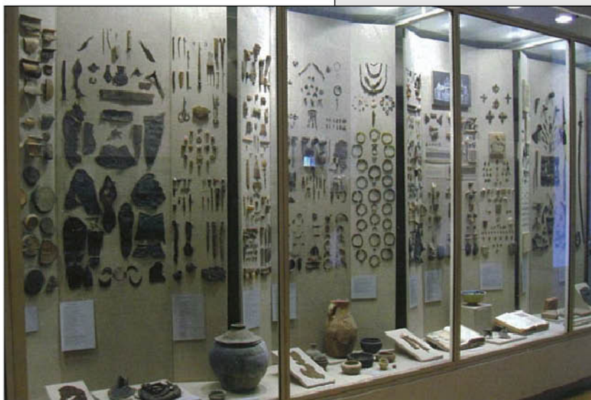
Фрагмент современной экспозиции Тверского музея. Археология.