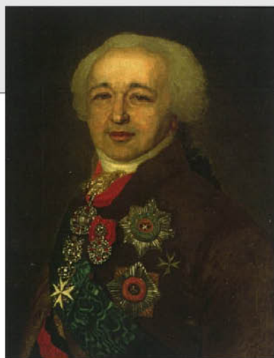
Неизвестный художник. Портрет Александра Борисовича Куракина. Нижегородский художественный музей.