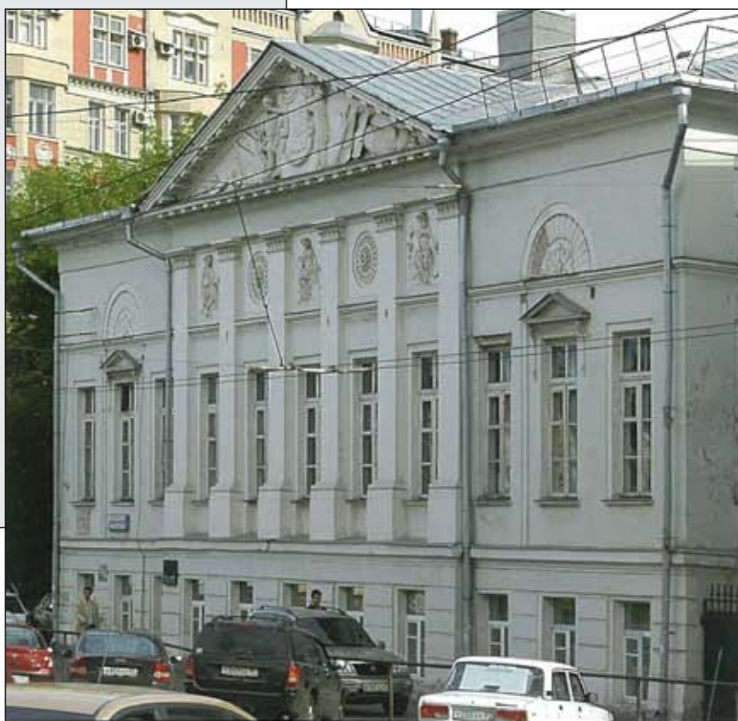
Дворец Куракина на Новой Басманной, д. 6.