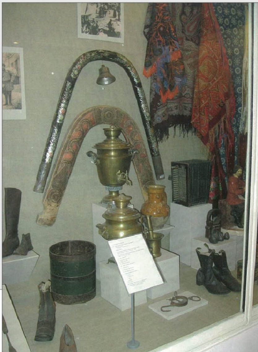
Экспозиция Тверского музея. Крестьянский быт. Ремесла.