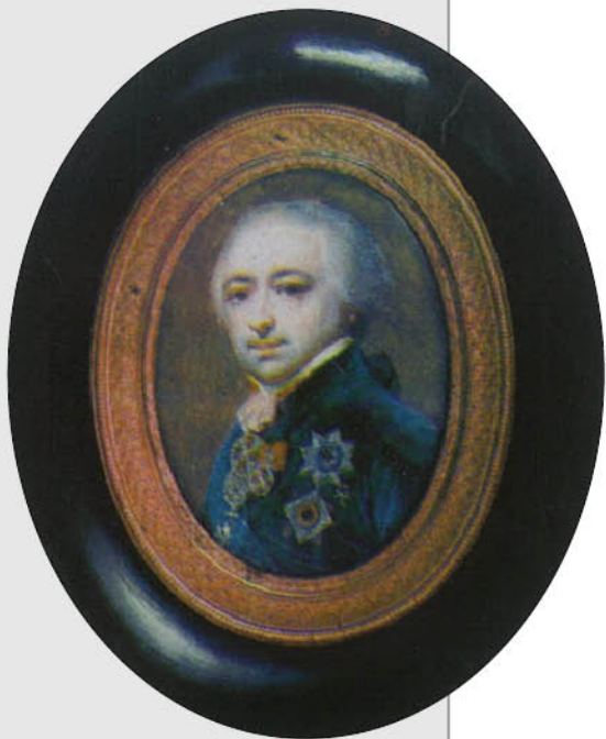
Неизвестный художник. Портрет князя Александра Борисовича Куракина. Миниатюра. Новгородский государственный объединенный музей- заповедник.