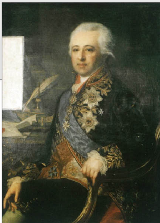
Неизвестный художник. Портрет князя Александра Борисовича Куракина. 1800-е гг. Тверская картинная галерея.