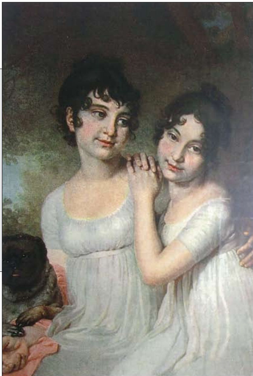
Княжны Куракины. Портрет работы В. Боровского. Из собрания кн. А.Б. Куракина.