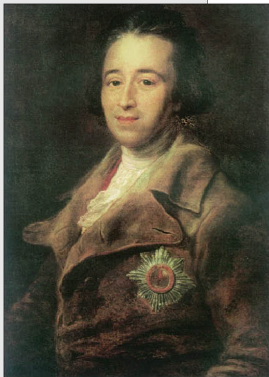
П. Батони. Портрет князя Александра Борисовича Куракина. 1782 г. ГЭ.