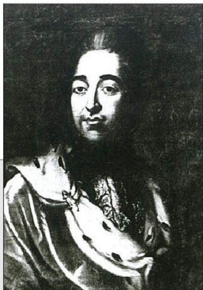
Неизвестный художник. Портрет князя Александра Борисовича Куракина. 1770-е гг. Тверская картинная галерея.