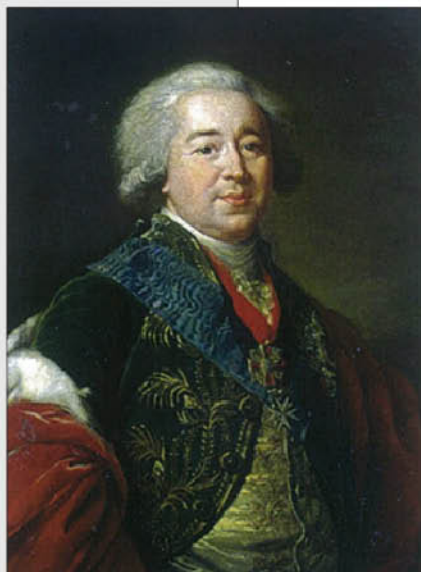
М.-Л.-Э. Виге-Лебрен. Портрет князя Александра Борисовича Куракина. 1796 г. ГЭ.