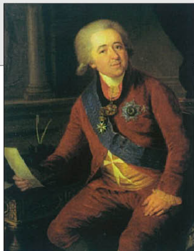
А. Гуттенбрунн. Портрет князя Александра Борисовича Куракина. 1800 г. ГРМ.