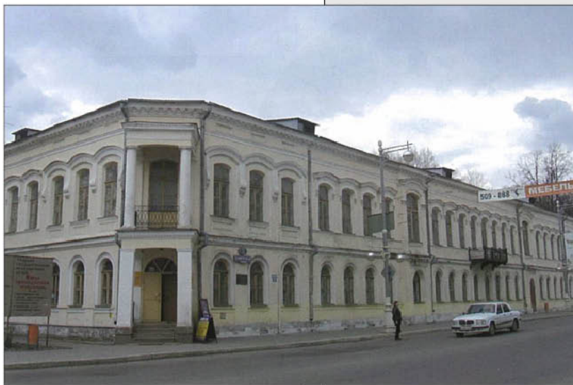
Тверской краеведческий музей (здание бывшего Реального училища).