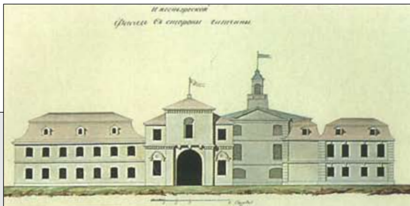
Гатчина. Дом Куракина.