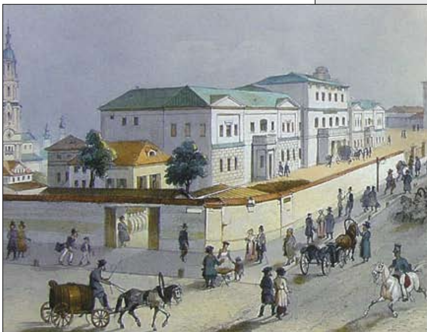
Фрагмент гравюры 1850-х гг. с изображением старого здания Почтамта.