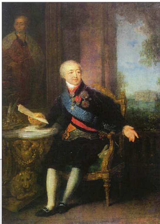
В.А. Боровиковский (?). Портрет князя Александра Борисовича Куракина. Начало 1800-х гг. ГИМ. Эскиз.