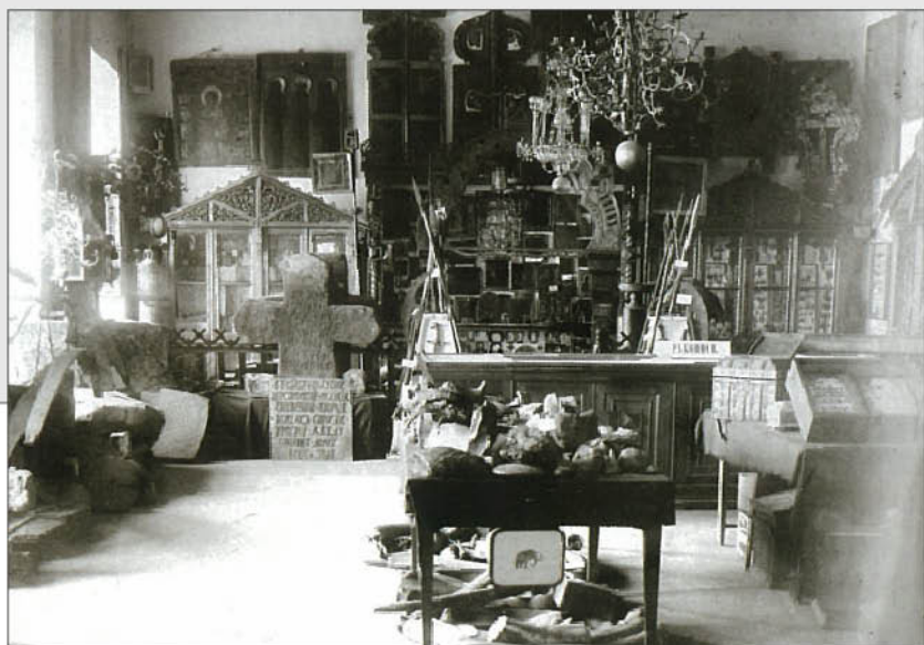
Экспозиция Тверского музея до 1941 г.