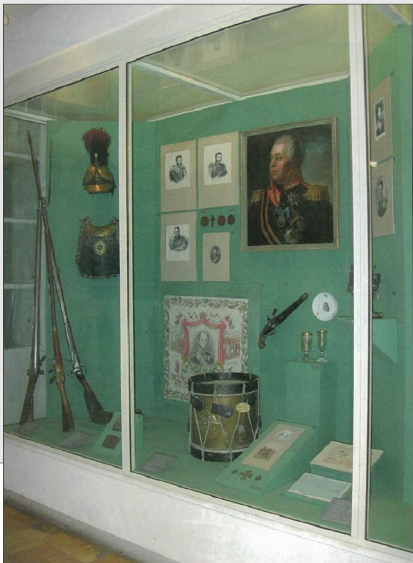
Зеленый зал Тверского музея. Война 1812 г.