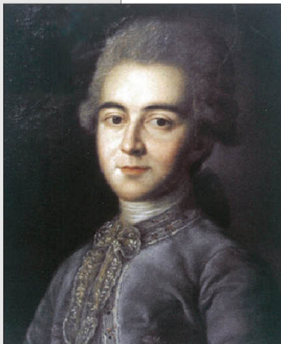
Неизвестный художник. Портрет князя Александра Борисовича Куракина. Тип Рослена. МЗ «Дмитровский Кремль».