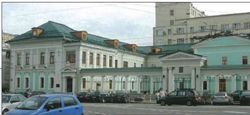
Странноприимный дом на Новой Басманной, д. 4.