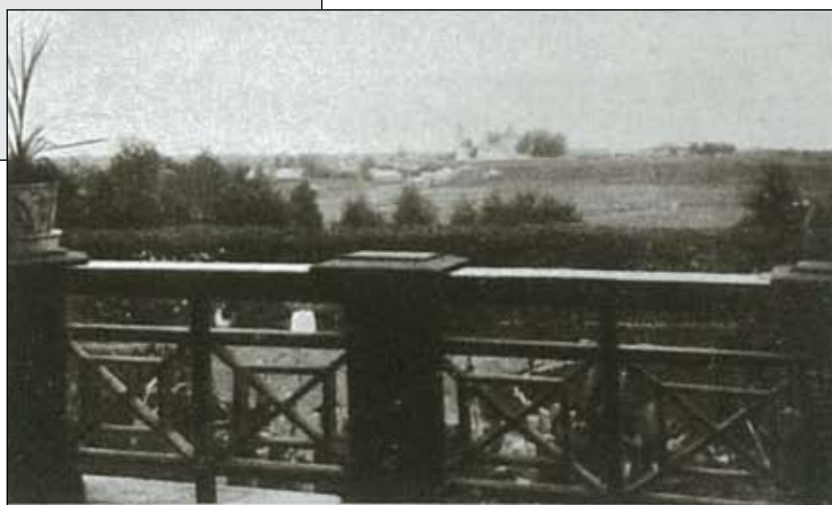
Видъ съ террасы усадьбы Андреевское на село Марьино.