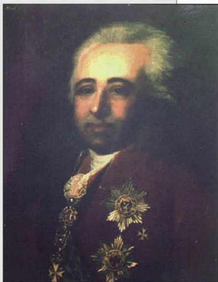
Неизвестный художник. Портрет князя Александра Борисовича Куракина. 1770-е гг. Тверская картинная галерея.