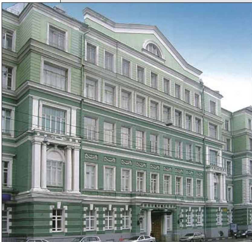
Дворец Куракина на Старой Басманной, д. 21 (ныне МГУиЭ).