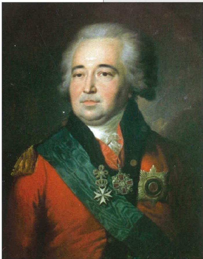
Неизвестный художник. Портрет князя Александра Борисовича Куракина. Орловский краеведческий музей.