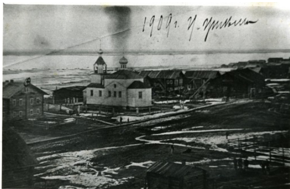
Старобрядческая церковь в селе Усть-Цильма во имя Николы Чудотворца. Фото 1909 г.