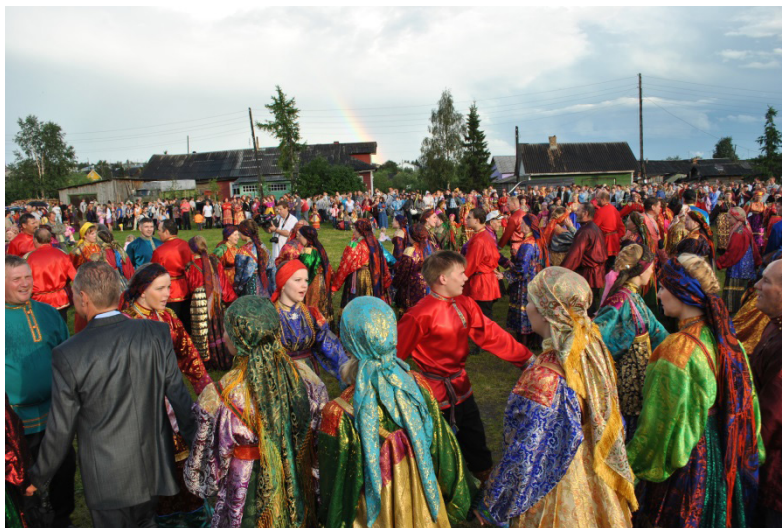
Хороводное гуляние «Усть-Цилемская горка». Республиканский праздник. Фото 2015 г.