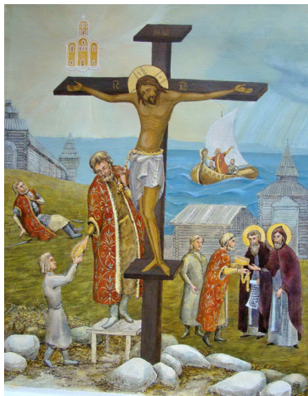
С.В. Сушкин «Деяния варяга Шимона»

вопрос, почему Христос изображен без раны от копья и не с гвоздями в ладонях, художник ответил: «Выше моих сил передать страдания Христа на моем детище – картине».