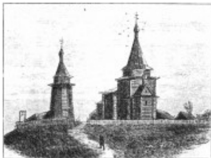
Рис. 44. С. Усть-Цильма. Церковь 1744 г.