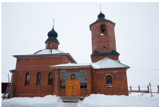
Старобрядческий храм в селе Усть-Цильма во имя Николы Чудотворца. Фото 2012 г.