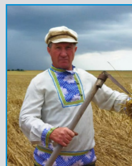
ЛУГОВСКОЙ СЕЛЬСКИЙ ДОМ КУЛЬТУРЫ (РЕСПУБЛИКА КРЫМ, РОССИЯ)

БУДЬ С НАМИ 12 ИЮЛЯ 2024 ГОДА – НАДЕНЬ КОСОВОРОТКУ – ВСПОМНИ, ЧТО ТЫ – РУССКИЙ!