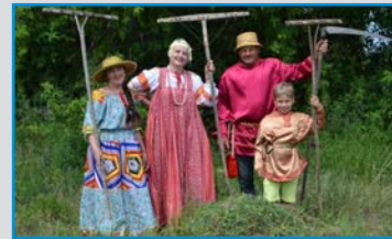
МКУК «ЗАВЬЯЛОВСКИЙ КУЛЬТУРНО-ДОСУГОВЫЙ ЦЕНТР» (С. ЗАВЬЯЛОВО, НОВОСИБИРСКАЯ ОБЛАСТЬ, РОССИЯ)