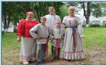
МУ «КУЛЬТУРНО-ДОСУГОВЫЙ ЦЕНТР» (П. СПИРОВО, ТВЕРСКАЯ ОБЛАСТЬ, РОССИЯ)