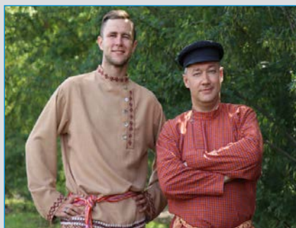
ГАУ РК «ДОМ ДРУЖБЫ НАРОДОВ РК» (РЕСПУБЛИКА КОМИ, РОССИЯ)