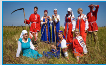
МБУК «РДК «ГОРИЗОНТ» (ПГТ. ЛЕНИНО, РЕСПУБЛИКА КРЫМ, РОССИЯ)