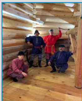
СТУДИЯ НАРОДНОГО КОСТЮМА «ВЕРЕТЁНЦЕ» (СВЕРДЛОВСКАЯ ОБЛАСТЬ, РОССИЯ)