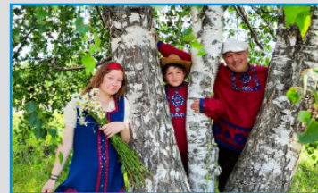
МБУК «ГОРОДСКОЙ ДОМ КУЛЬТУРЫ» (СВЕРДЛОВСКАЯ ОБЛАСТЬ, Г. СЕРОВ, РОССИЯ)